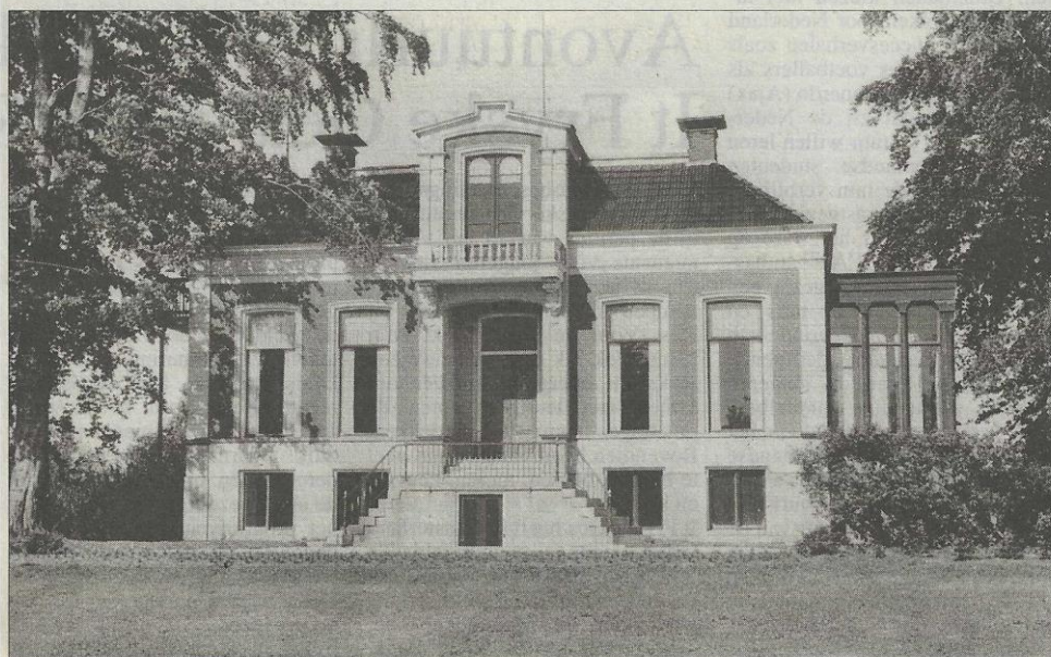
Ansichtkaart van het Jeltingahuis te Buitenpost, een opname uit het midden van de 20e eeuw.

Dit was een publicatie namens de Stichting Oud-Achtkarspelen