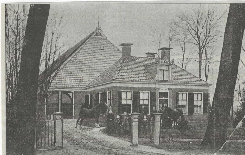
Opname van het voorhuis met schuur "Bouwwijk", te Buitenpost (niet meer aanwezig), waar vele jaren door de familie Sikkama het bedrijf werd uitgeoefend. De afgebeelde personen zijn onder andere van de latere bewoners Van der Zwaag.