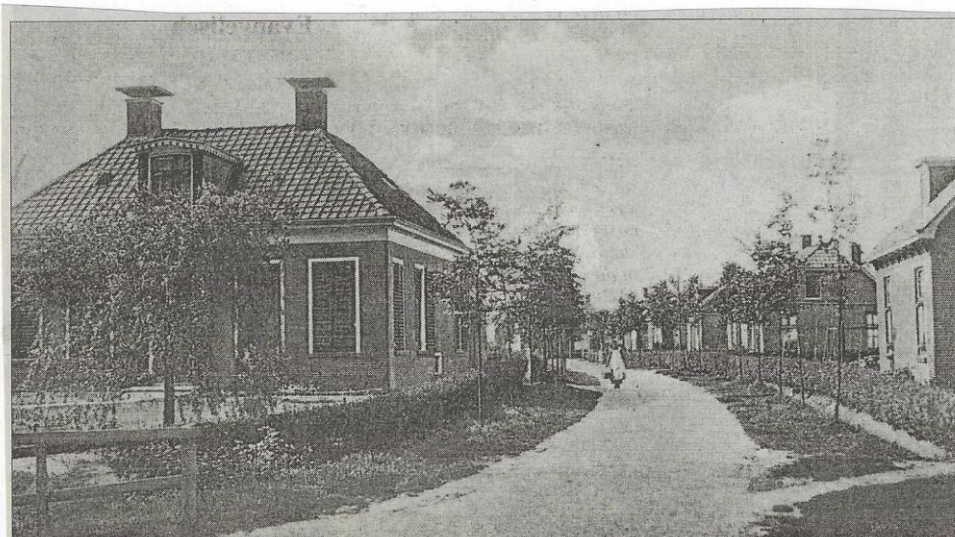
De weg Bouwwijk (nu Herbrandastraat) in vroegere jaren. De oorspronkelijke bebouwing is door nieuwbouw vervangen.